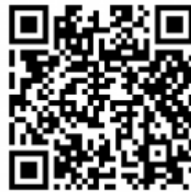
CoolWear para iOS