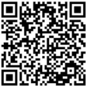
CoolWear para Android

https://apps.apple.com/es/app/coolwear/id1530655491